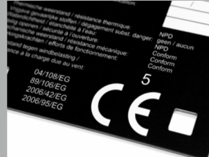
Industrie- und Typenschilder für Maschinen und Teile

Möchten Sie noch mehr erfahren oder haben Sie eine konkrete Problemstellung, gerne können wir Sie auch persönlich beraten!