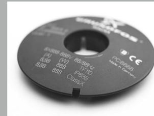
Markierung von Kunststoffen