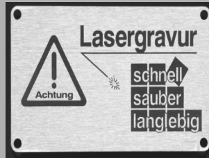
Firmenlogos und funktionale Beschriftungen

Die Beschriftung oder Gravur erfolgt durch den Laser kontaktlos, ohne die Oberfläche zu beschädigen.